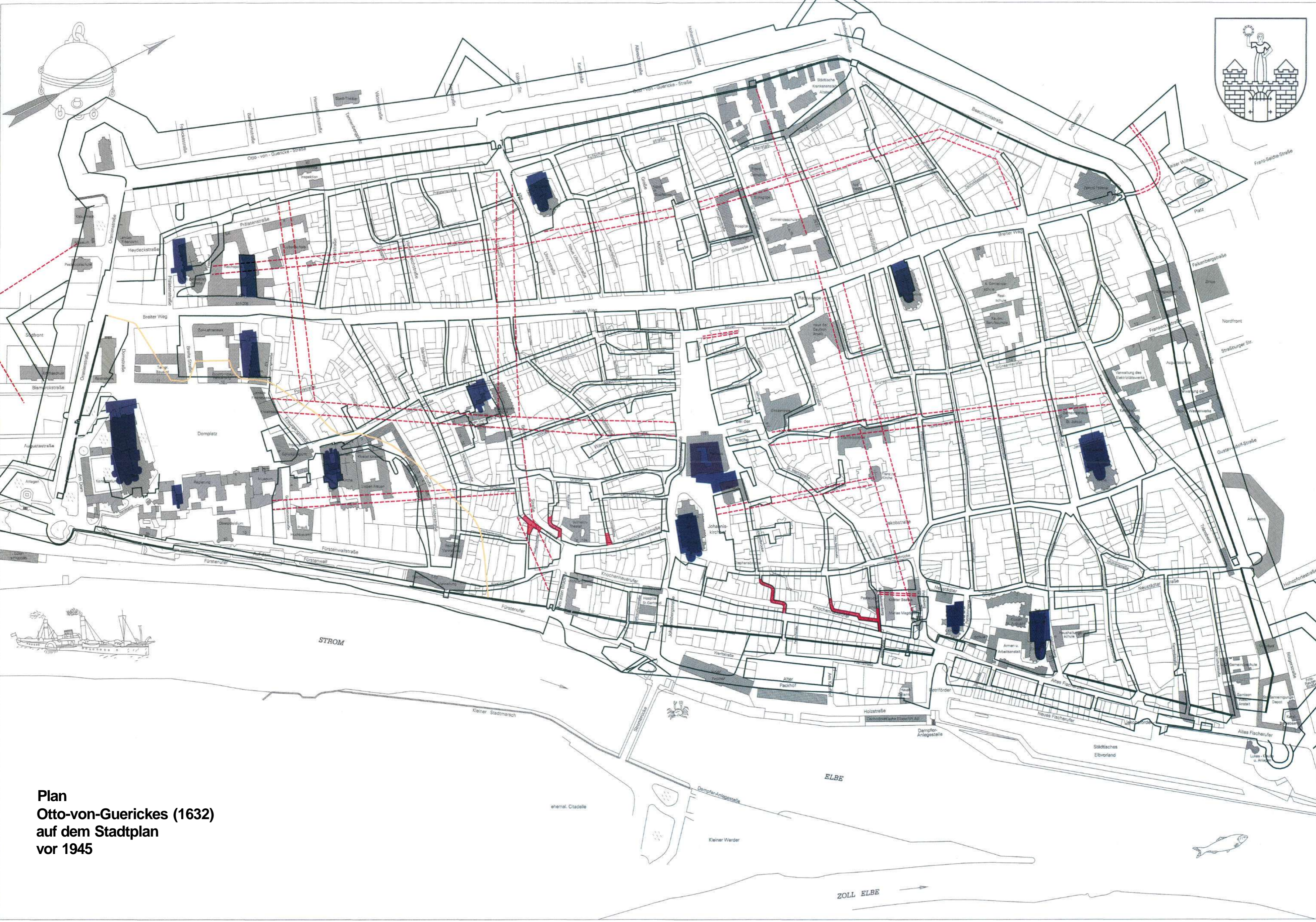
Plan Otto-von-Guerickes (1632) auf dem Stadtplan vor 1945