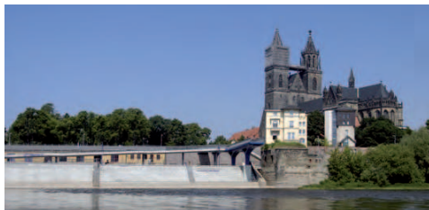
Fußgängerbrücke über das Schleifufer 28

Vorbei an den ehemaligen Flachspeichern mit ihrem Kontorgebäude, die zu Loftwohnungen umgebaut wurden, fährt man zum Herzstück des IBA-Projektes: Elbbahnhof 29 . Im Zentrum des neu gestalteten Platzes steht der „Zeitähler“, eine Skulptur von Gloria Friedmann, ein Ergebnis des internationalen Kunstprojektes „DIE ELBE [in] between“. Darüber hinaus gewährt der Platz mit dem gläsernen Elbbalkon Blickbeziehungen zur Hubbrücke 30 , zum Landesfunkhaus des mdr 41 und zur Stadthalle 40 . Der Weg führt hinter dem Kavalier I „Scharnhorst“ 31 entlang Richtung Sternbrücke 32 . Von hieraus gelangen Sie über die Sternbrücke mit Blickrichtung Aussichtsturm 39 in den Stadtpark Rotehorn . Die Fahrt führt über den kleinen Stadtmarsch vorbei an dem linker Hand als Museumsschiff mit Gastronomie liegenden historischen Raddampfer „Württemberg“ und der rechter Hand liegenden Stadthalle. Der Weg führt Sie weiter entlang der Elbe vorbei am Landesfunkhaus des mdr. Es werden Ihnen Blickbeziehungen zur Altstadtsilhouette ermöglicht. Über die Zollbrücke 17 vor der Anna-Ebert-Brücke abbiegend, dem Verlauf der Alten Elbe folgend fahren Sie über die Jerusalem- und Friedensbrücken 6 zu Ihrem Tourenziel der Elbuferpromenade 13 . Der Weg führt vorbei am IBA-Projekt: Lukasklausen, Otto-von Guericke-Zentrum 8 .