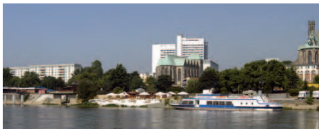
Elbuferpromenade und Petriförder 13

In der Altstadt soll das städtische Leben intensiviert werden. Am Hochufer der Altstadt und am ehemaligen Elbbahnhof wird eine weitere Aufwertung des Elbufers und eine bessere räumliche Verknüpfung mit der Stadt angestrebt. Entdecken Sie den IBA-Schauplatz Altstadt auf einem Fahrradrundkurs.