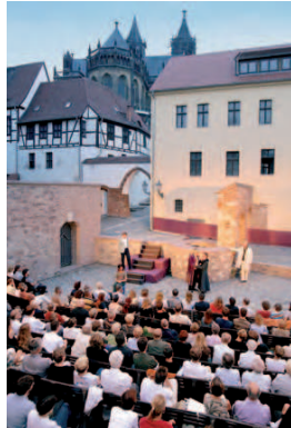
Haus der Romanik 26

und Domplatzes 24 laden weitere touristische Sehenswürdigkeiten wie zum Beispiel das Haus der Romanik 26 , der Möllenvogteigarten, der Wehrturm „Kiek in de Köken“ 25 und die Festungsanlage Bastion Cleve 27 zu einem Besuch ein. Über den Weg der Ottonen vorbei am 40. FrauenOrt gelangt man zur Fußgängerbrücke über das Schleifufer und dem Eisenbahntor 28 . Die neue, im Rahmen der IBA 2010 errichtete Brücke sorgt für eine bessere Anbindung der Innenstadt an die Elbuferpromenade. Die neue Aussichtsplattform über den Fluss eröffnet völlig neue Blickperspektiven.