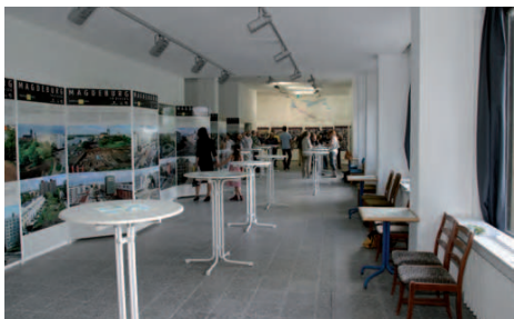
Blick in den IBA-Shop 18

Nach dem Start am Petriförder 13 führt der Weg über die Fußgänger- und Radbrücke am Schleifufer. Auf Ihrem Weg zur Jakobstraße liegt rechter Hand die Magdalenenkapelle 12 , linker Hand befinden sich die Johanniskirche 14 , das Rathaus 15 , der Alte Markt , der Magdeburger Reiter und der Roland . In unmittelbarer Nähe auf Ihrem Weg durch die Jakobstraße befindet sich die Tourist-Information Magdeburg 16 . Der Weg führt weiter an der Rückseite des Rathauses entlang über die Ernst-Reuter-Allee zum IBA-Shop 18 . Mit ihrer städtebaulich markanten Lage in der Nähe vom Kunstmuseum Kloster Unser Lieben Frauen 20 sowie Info-Pavillon am Kunstmuseum 19 steht die 1968/69 erbaute Wohn-