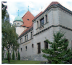
Kulturhistorisches Museum 23

scheibe Regierungsstraße 37 mit Geschäftsunterlagerungen, die zur Zeit als IBA-Shop mit Ausstellungsprojekten genutzt wird.