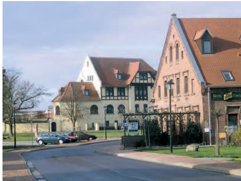
Dorf- und Kirchplatz in Sohlen

westlichen Teil von Westerhüsen . Über die Arnold-Knoblach-Straße, einem weiteren städtebaulich interessanten Wohngebiet, verlassen Sie die Stadt. Überqueren Sie die Sohlener Straße und setzen Sie Ihre Fahrt auf dem straßenbegleitenden Radweg in Richtung Sohlen fort. Auf beiden Seiten der Straße breiten sich Felder aus. Linkerhand erhebt sich der Frohser Berg . Ca. 500 m nach einem freistehenden Gehöft biegen Sie auf einen Feldweg ein und fahren direkt auf den Frohser Berg zu. Mit seinen 115 m Höhe und einem Sendemast auf der Bergkuppe hebt er sich deutlich vom Umland ab und ist weithin zu sehen. An der nächsten