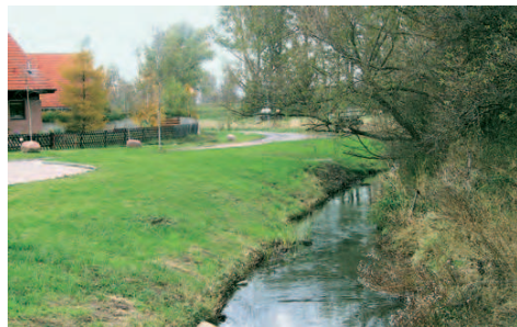
Blick auf die Sülze

Entdecken Sie den Süden Magdeburgs, welcher sich mit einer bis zu 115 m hohen Hügelkette deutlich vom Umland abhebt.