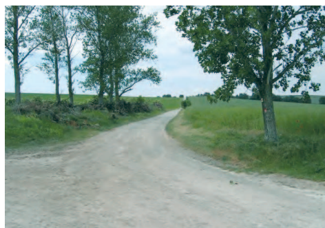
Feldweg am Frohser Berg

Am Ausgang des Bahnhofs wenden Sie sich nach links in die Welseber Straße und fahren durch den städtebaulich markanten