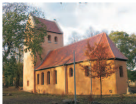
Kirche St. Petrus und Paulus (St. Petri)

An einer Gabelung am Waldesrand geht es hinab nach Beyendorf . Sie queren dort die Sülze und erreichen über die Schulstraße die rekonstruierte romanische Dorfkirche St. Petrus und Paulus 2. Über die Straße „Sülzblick“ und Straße „Rote Mühle“ verlassen Sie den Ort. Sie fahren weiter auf einem Feldweg und passieren dabei die Rote Mühle und die Vikarienmühle . Auch hier ist mit schlechter Wegstrecke zu rechnen. Die Wegführung ermöglicht Ihnen weiterhin einen Blick auf die östlich der Sülze liegenden Sohlener Berge. Die dörfliche