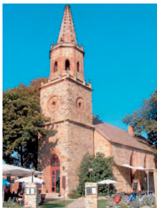
Dorfkirche St. Immanuel Magdeburg

Prester See bis zu einer Pflaster-Überfahrt. Dort ist rechter Hand eine Holztafel mit Angaben zu Hochwasser-Pegelständen. Biegen Sie nach Osten in Richtung Leuschnerstraße ab und Sie gelangen somit zum Ausgangspunkt der Tour: Endstelle Tram Linie 4, Cracau/Pechauer Platz .