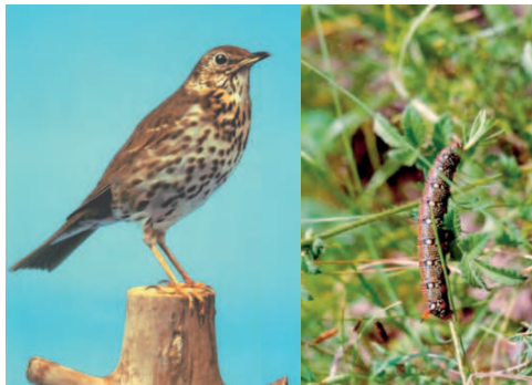
Unberührte Lebensräume in der „Kreuzhorst“

In der typischen Vegetation eines Überflutungsbereiches leben hier etwa 30 verschiedene Säugetier- und 90 Buntvogelarten sowie verschiedene Reptilien und Amphibien. Einen halben Kilometer weiter nördlich ist ein stimmungsvoller Blick auf den Dom möglich. Dann elbabwärts geht die Fahrt zum Dorf Prester. Empfehlenswert: ein kleiner Zwischenstopp bei der einstigen Dorfkirche St. Immanuel . Weiter gehts auf dem Elbdeich: Folgen Sie dem langgestreckten