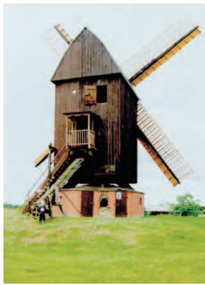
Eine Mühle am Wegesrand