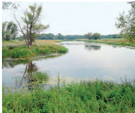
Elbauenland bei Magdeburg

Auf 22 km Länge können Sie die Elbauenlandschaft naturnah und familienfreundlich erleben. Wir empfehlen Ihnen eine Tour vom