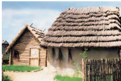
Slawisches Dorf in Pechau 1

Nehmen Sie den Klusdamm, eine in Richtung Südosten laufende Straße. Der Klusdamm, eine alte Heer- und Handelsstraße, wurde